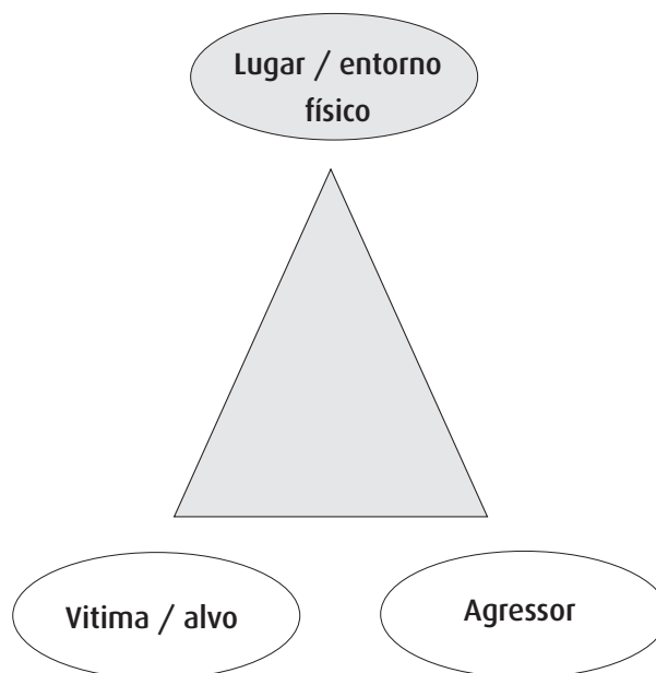
Gráfico 1 Triângulo do crime